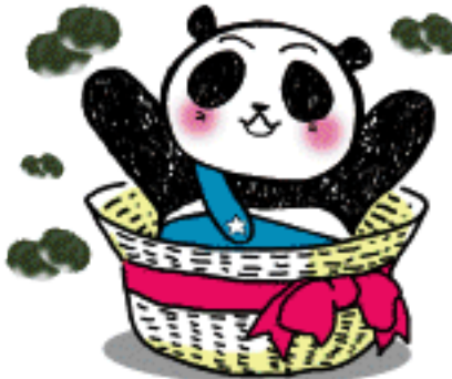
“塗りパンダのきよし君”

(ただし屋根の形状やサッシの形状、大きさなどで大きく差が出るのでご相談下さい) 我社も一部外壁と、駐車場の舗装面を塗装しましたが、真夏の「ムワッ」とするあの暑さがやわらぎました。遮熱塗料いいですよ～★