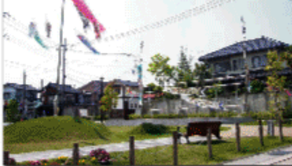
1 般ヶ丘商店街では端午の節句をしております。(5月下旬まで)